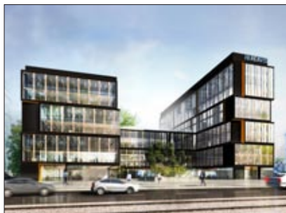
HB-Reavis entwickelt in Warschau das Büroprojekt Postepu 14 mit gut 34.000 Quadratmeter Mietfläche.