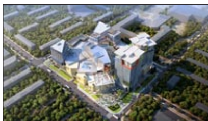
Kuntsevo Plaza in Moskau soll bis August 2014 fertiggestellt sein.